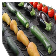
Selezionare l'ortofrutta: le novità di Unitec