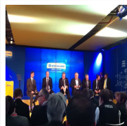
New Holland: l'eccellenza nel cuore