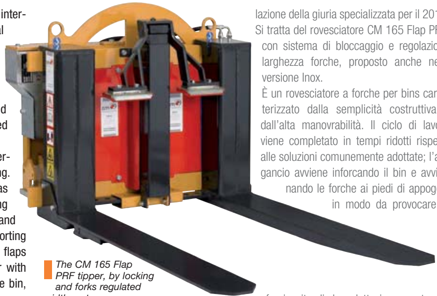
■ The CM 165 Flap PFR tipper, by locking and forks regulated width system.

il rovesciatore CM 165 Flap PFR, con sistema di bloccaggio e regolazione larghezza forche.