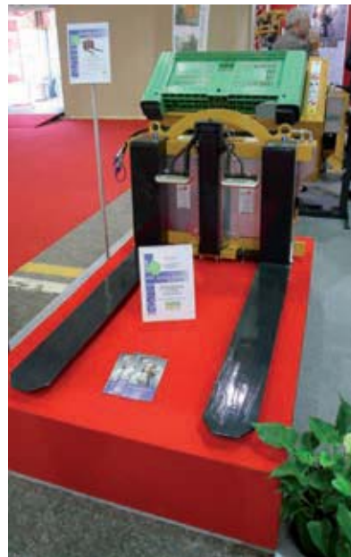
■ Enforceable to forklifts, it's suitable for tipping and handling bins.

CM all'ultima edizione dell'Eima, l'esposizione internazionale di macchine per l'agricoltura, ha presentato un nuovissimo rovesciatore che si è aggiudicato la segna-