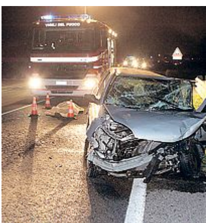
La Renault Clio sulla quale viaggiavano le due vittime

Comitiva di anziani tornava da una cena Due morti e quattro feriti nello schianto sulla statale Romea