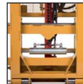
Traslatore laterale Side shift