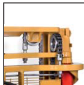
Catene di sollevamento Fleyer "Fleyer" type lifting chains