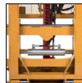
Traslatore laterale Side shift