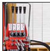
Distributore 4 leve Distributor with 4 levers