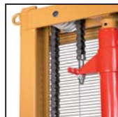
Catene di sollevamento standard Standard lifting chains