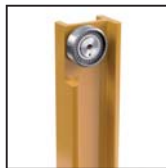
Cuscinetti radiali a rulli cilindrici Straight roller radial bearings