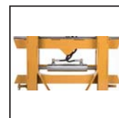
Traslatore laterale Side shift