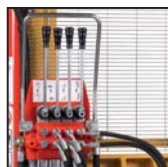
Distributore 4 leve Distributor with 4 levers