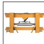
Traslatore laterale Side shift