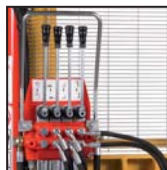
Distributore 4 leve Distributor with 4 levers