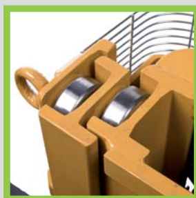
Profili in acciaio laminati a caldo Hot-rolled steel profiles