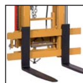
Forche FEM FEM forks