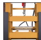
Traslatore laterale FEM FEM side shift