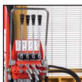
Distributore 4 leve Distributor with 4 levers