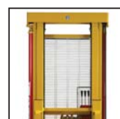
Ottima visibilità Great visibility