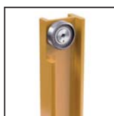
Cuscinetti radiali a rulli cilindrici Straight roller radial bearings