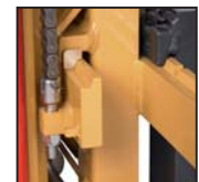
Pattini traslatore laterale FEM FEM side shift pads