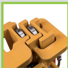
Profili in acciaio laminati a caldo Hot-rolled steel profiles