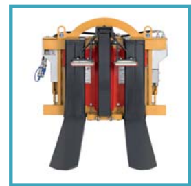
Forche in posizione chiusa Horquillas en posición cerrada