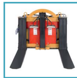
Forche in posizione aperta Horquillas en posición abierta