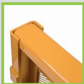
Profili in acciaio piegato Bent steel profiles