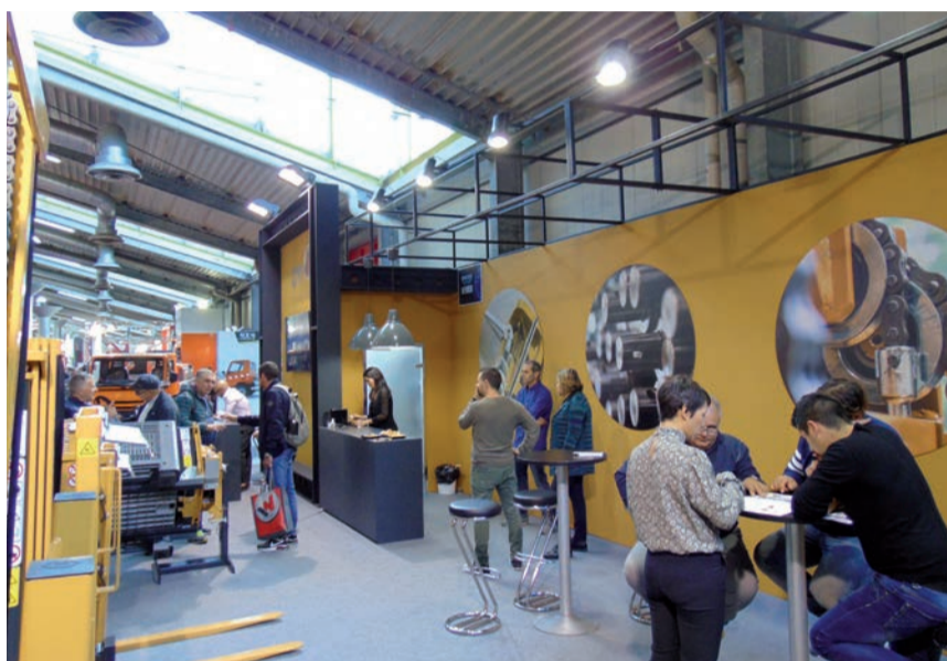
► CM si è presentata all'EIMA con uno stand rinnovato e più ampio, perfetta espressione della nuova immagine della società

livelli di sicurezza. Novità anche sul fronte degli accessori, arricchiti dal nuovo strigicasse idraulico e dal girafusti idraulico per frantoi e industrie alimentari.