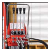
Distributore 4 leve Distributeur 4 leviers