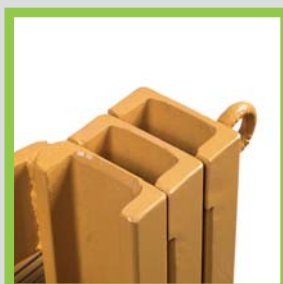
Profili in acciaio laminati a caldo Profils en acier laminés à chaud