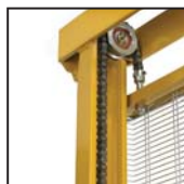
Catene di sollevamento standard Cadenas de elevación estándar