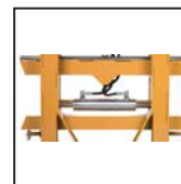
Traslatore laterale Desplazamiento lateral