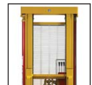
Ottima visibilità Excelente visibilidad