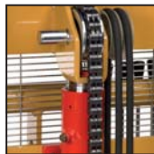
Catena di sollevamento tipo "Fleyer" Cadena de elevación tipo "Fleyer"