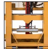
Traslatore laterale Desplazamiento lateral