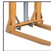
Forche pieghevoli e regolabili Horquillas plegables y ajustables