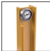
Cuscinetti radiali a rulli cilindrici Rodamientos de rodillos cilíndricos