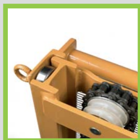
Profili in acciaio laminati a caldo Perfiles de acero laminados en caliente