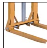
Forche pieghevoli e regolabili Horquillas plegables y ajustables