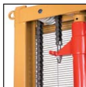
Catene di sollevamento standard Cadenas de elevación estándar