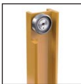
Cuscinetti radiali a rulli cilindrici Rodamientos de rodillos cilíndricos