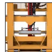
Traslatore laterale Desplazamiento lateral