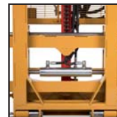
Traslatore laterale Translateur latéral