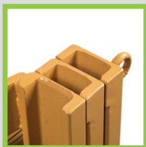
Profili in acciaio laminati a caldo Profils en acier laminés à chaud