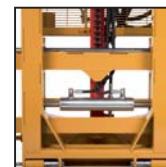
Traslatore laterale Desplazamiento lateral