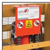
Catene di sollevamento tipo "Fleyer" Cadenas de elevación tipo "Fleyer"