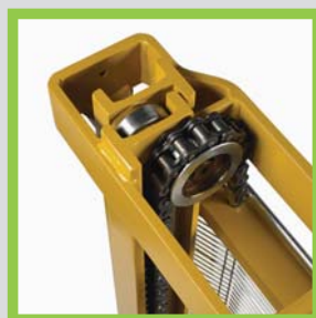
Profili in acciaio laminati a caldo Profils en acier laminés à chaud