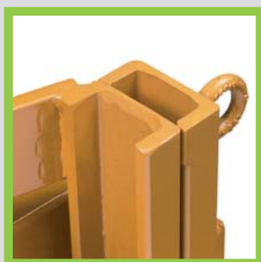
Profili in acciaio laminati a caldo Profils en acier laminés à chaud