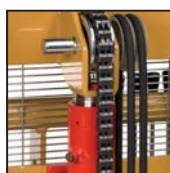
Catena di sollevamento tipo "Fleyer" Chaîne de levage type "Fleyer"