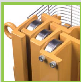
Profili in acciaio laminati a caldo Profils en acier laminés à chaud