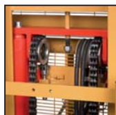
Catene di sollevamento tipo "Fleyer" Chaînes de levage type "Fleyer"