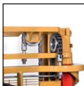
Catene di sollevamento tipo "Fleyer" Chaînes de levage type "Fleyer"