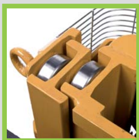
Profili in acciaio laminati a caldo Profils en acier laminés à chaud