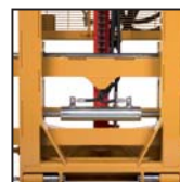
Traslatore laterale Desplazamiento lateral