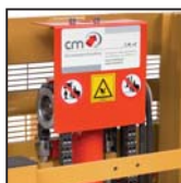
Catene di sollevamento tipo "Fleyer" Cadenas de elevación tipo "Fleyer"