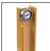
Cuscinetti radiali a rulli cilindrici Roulements à rouleaux cylindriques