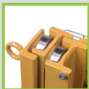
Profili in acciaio laminati a caldo Profils en acier laminés à chaud