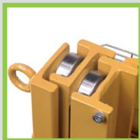
Profili in acciaio laminati a caldo Profils en acier laminés à chaud