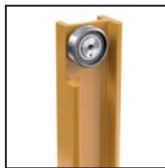
Cuscinetti radiali a rulli cilindrici Roulements à rouleaux cylindriques