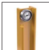
Cuscinetti radiali a rulli cilindrici Roulements à rouleaux cylindriques