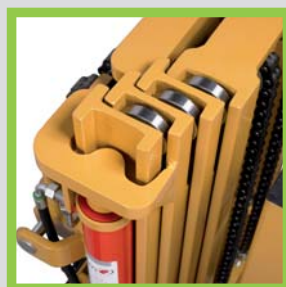
Profili in acciaio laminati a caldo Profils en acier laminés à chaud