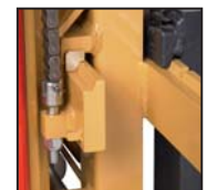
Pattini traslatore laterale FEM Patins translateur latéral FEM