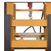
Traslatore laterale FEM Translateur latéral FEM