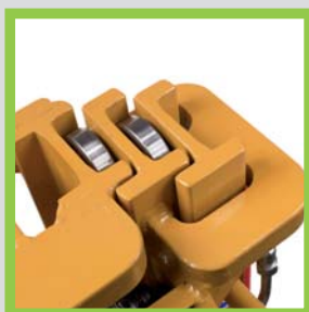
Profili in acciaio laminati a caldo Profils en acier laminés à chaud