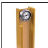
Cuscinetti radiali a rulli cilindrici Roulements à rouleaux cylindriques