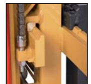
Pattini traslatore laterale FEM Patines desplazamiento lateral FEM