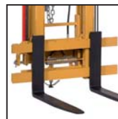
Forche FEM Horquillas FEM