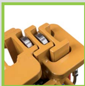
Profili in acciaio laminati a caldo Perfiles de acero laminados en caliente