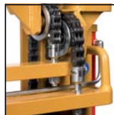
Catene di sollevamento tipo "Fleyer" Cadenas de elevación tipo "Fleyer"