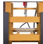
Traslatore laterale FEM Desplazamiento lateral FEM