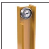
Carrello con cuscinetti radiali a rulli cilindrici Chariot avec roulements à rouleaux cylindriques