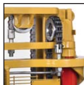
Catene di sollevamento tipo "Fleyer" Cadenas de elevación tipo "Fleyer"