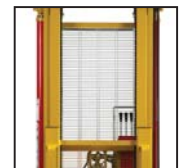
Ottima visibilità Excelente visibilidad