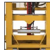
Traslatore laterale Desplazamiento lateral