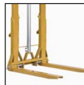
Forche pieghevoli e regolabili Horquillas plegables y ajustables