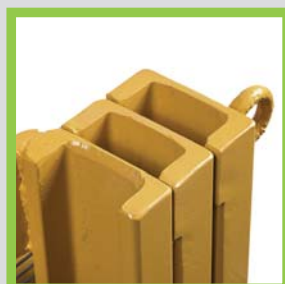
Profili in acciaio laminati a caldo Profils en acier laminés à chaud