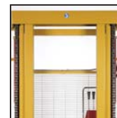
Ottima visibilità Visibilité maximale