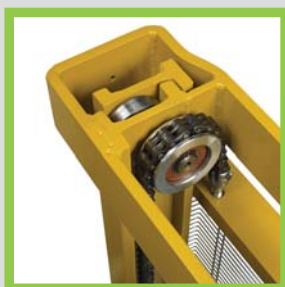
Profili in acciaio laminati a caldo Profils en acier laminés à chaud