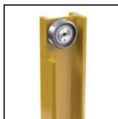
Cuscinetti radiali a rulli cilindrici Roulements à rouleaux cylindriques