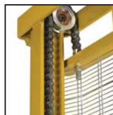
Catene di sollevamento tipo "Fleyer" "Fleyer" type lifting chains