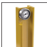
Cuscinetti radiali a rulli cilindrici Straight roller radial bearings