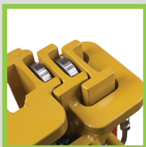
Profili in acciaio laminati a caldo Hot-rolled steel profiles