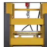
Traslatore FEM FEM side shift