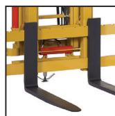
Forche FEM FEM forks