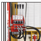
Distributore 4 leve Distributor with 4 levers