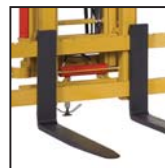
Forche FEM Horquillas FEM