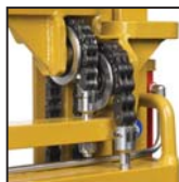
Catene di sollevamento tipo "Fleyer" Cadenas de elevación tipo "Fleyer"