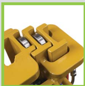
Profili in acciaio laminati a caldo Perfiles de acero laminados en caliente