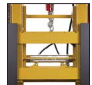
Traslatore FEM Desplazamiento FEM