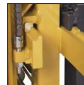
Pattini traslatore laterale FEM Patines desplazamiento lateral FEMs