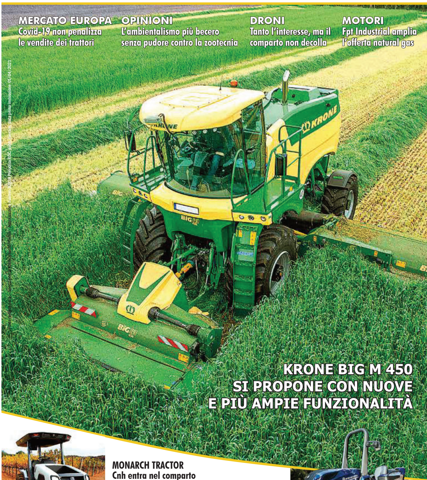
Foto: Fendt - s.p.a. - Sesto San Giovanni - Piacenza - Autotrazione numero 00338 Periodico ROC, pubblicazione data prima immissione 01/04/2021

KRONE BIG M 450 SI PROPONE CON NUOVE E PIÙ AMPIE FUNZIONALITÀ